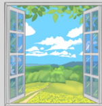
Rotura accidental de vidrios