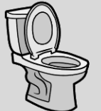
Robo de instalaciones fijas

10% del monto indemnizable Mínimo: $200 Mínimo: S/. 600